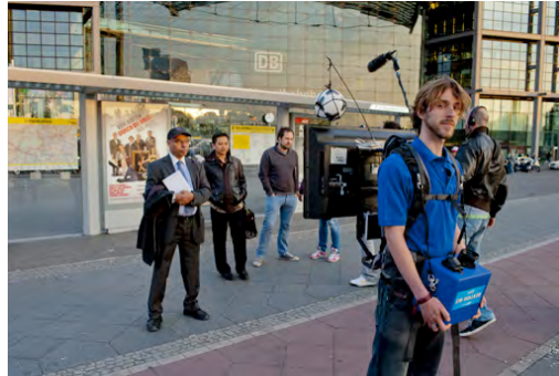
Bildunterschrift: Die EURONICS EM-Walker überall dort unterwegs, wo Fans arbeiten mussten oder verhindert waren.