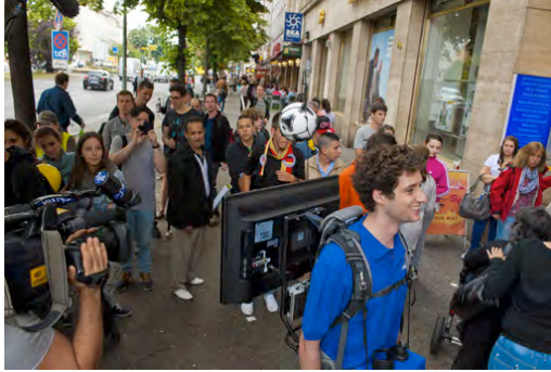
Bildunterschrift: Mit Fernsehern von Samsung im Rucksack bietet EURONICS Berlinern ein Fußball-Erlebnis der besonderen Art.