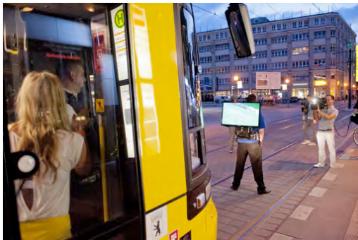
Bildunterschrift: Egal ob Busfahrer, Kellner oder wartende Fluggäste, dank der neuesten Guerilla-Aktion von EURONICS konnten auch die Fans mit den beiden Mannschaften mit fiebern.