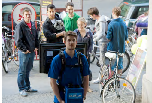
Bildunterschrift: Ein EURONICS EM-Walker in Aktion.